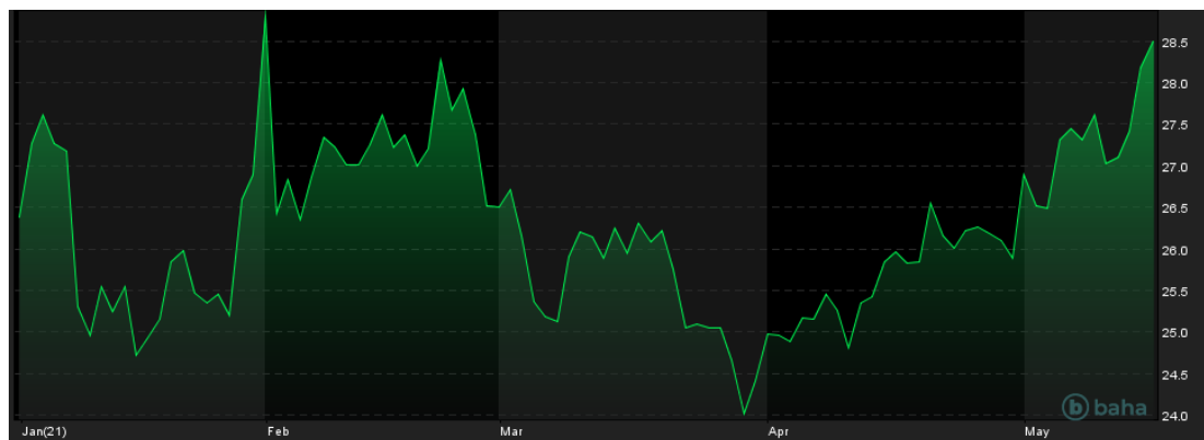
Notowania cen srebra, YTD

SUPERFUND TFI S.A., INFOLINIA: +48 22 556 88 62, WWW.SUPERFUND.PL