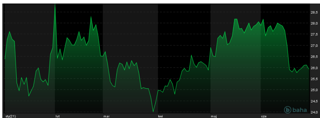
Notowania cen srebra, YTD, źródło: baha.com

SUPERFUND TFI S.A., INFOLINIA: +48 22 556 88 62, WWW.SUPERFUND.PL