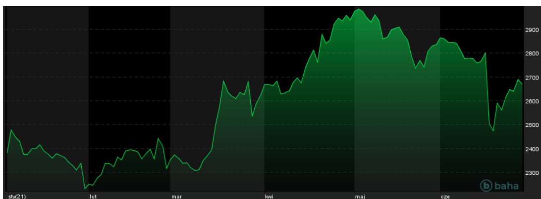
Notowania cen palladu, YTD

W poprzednim tygodniu przyszedł czas na uspokojenie nastrojów i próbę odbicia notowań szlachetnych kruszców w górę. Udało się to jednak tylko częściowo. W górę ruszyły przede wszystkim ceny palladu, czyli metalu, który ma najbardziej sprzyjające stronie popytowej fundamenty. Na rynku palladu w tym roku już po raz kolejny ma pojawić się spory deficyt.