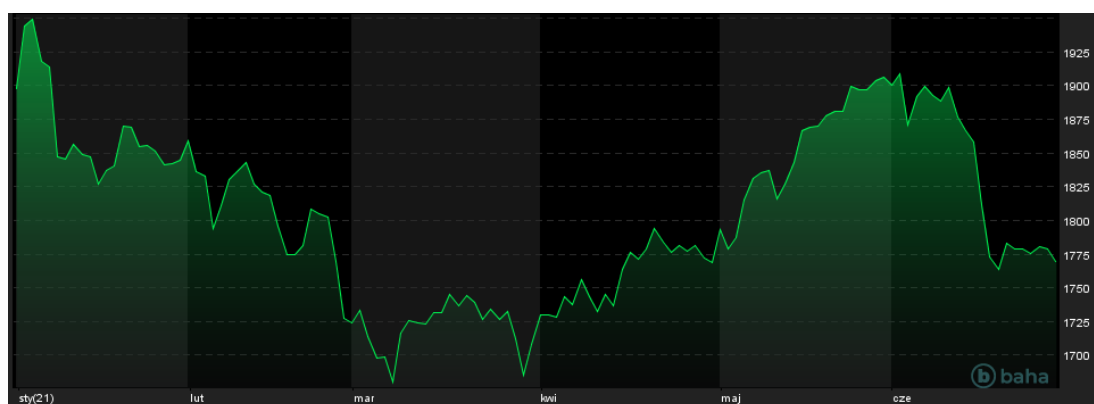
Notowania cen złota, YTD, źródło: baha.com

Notowania metali szlachetnych zanurkowały w połowie czerwca. Ceny kontraktów na złoto zniżkowały wtedy z okolic 1900 USD za uncję do rejonu 1760 USD za uncję. Analogiczne ruchy miały miejsce na rynkach pozostałych kruszców. Srebro potaniało z 28 USD za uncję do poziomu poniżej 26 USD za uncję, notowania platyny w kilka dni zniżkowały z rejonu 1170 USD za uncję do 1030 USD za uncję, a ceny palladu 17 czerwca zrobiły jedną imponującą świecę spadkową, która zniósła notowania z okolic 2800 USD za uncję do rejonu 2500 USD za uncję.