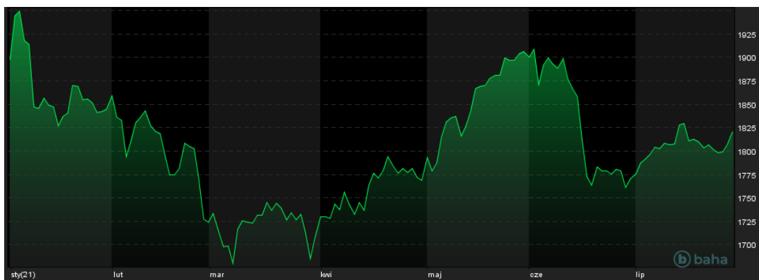
Notowania cen złota, YTD, źródło: baha.com