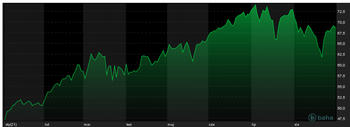
Notowania cen ropy WTI, YTD