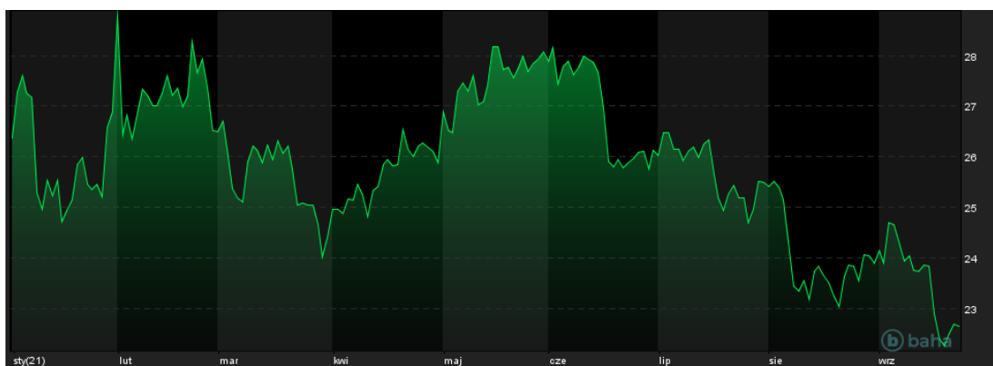
Notowania cen srebra, YTD, źródło: baha.com

Warto zwrócić uwagę na fakt, że o ile siła dolara negatywnie wpłynęła także na ceny srebra, to mimo wszystko notowaniom tego metalu udało się zakończyć sesję na plusie. Wynika to z faktu, że w ostatnich dniach srebro wyraźnie reagowało na doniesienia dotyczące sytuacji w Chinach. Kruszec ten jest wykorzystywany w dużym stopniu w przemyśle, więc nastroje inwestorów związane z koniunkturą w globalnej gospodarce mają na rynku srebra duże znaczenie.