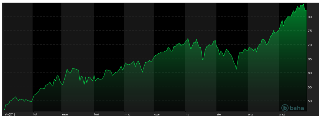
Notowania cen ropy WTI, YTD, źródło: baha.com