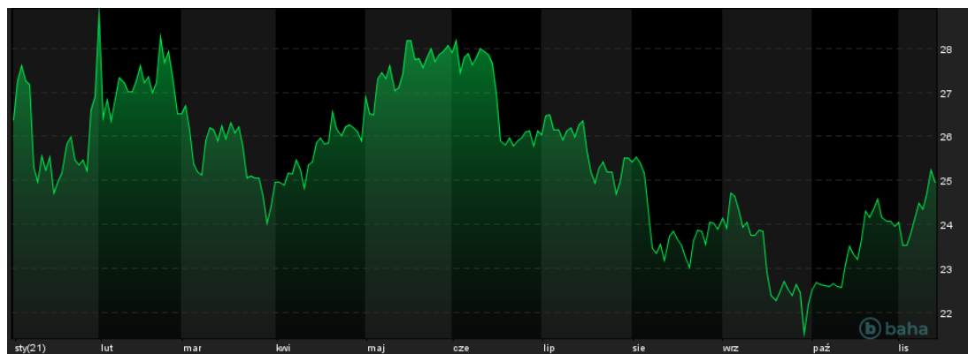
Notowania cen srebra, YTD

Obecnie, cena srebra przekracza już 25 USD za uncję, co jest najwyższym poziomem notowań od około trzech miesięcy, czyli od pierwszej połowy sierpnia bieżącego roku.