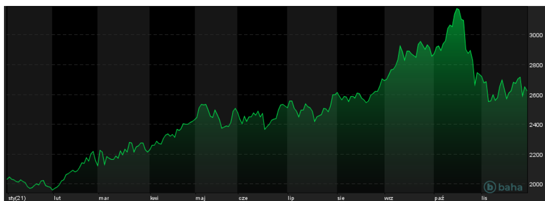
Notowania cen aluminium LME (3M), YTD

Kontrakty terminowe (3M) na aluminium notowane w Londynie zanotowały spory spadek ceny podczas piątkowej paniki spowodowanej niepokojącymi doniesieniami o najnowszej mutacji wirusa SARS-CoV-2 o nazwie Omikron. W czwartek aluminium notowane było najwyżej od 4 listopada czyli powyżej 2710 $/MT, jednak piątkowa sesja zweryfikowała plany kupujących, bowiem cena wróciła do poziomów w okolicach 2600 $/MT. Natomiast początek tygodnia przyniósł lekkie wzrosty na wspomnianym rynku. Pierwszą grudniową sesję w dodatku napędza komunikat o spadku zapasów tego stopu na giełdzie LME aż o 7200 ton do poziomu 893775 ton, najniższego od 2007 roku. Warto wspomnieć, że zapasy topnieją aż 53. dzień z rzędu, co jest najdłuższą taką serią od 2018 roku. Następuje to głównie przez zwiększony popyt w Azji.