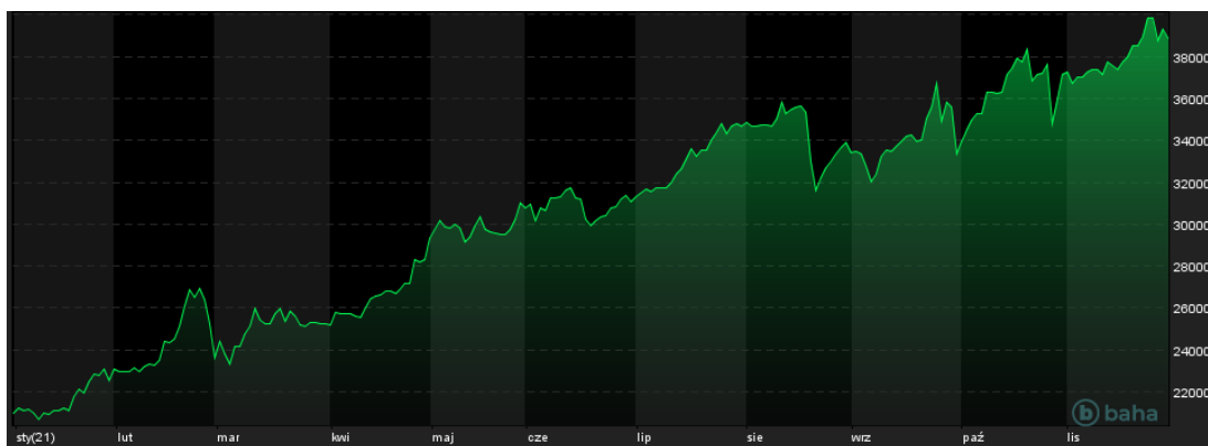
Notowania cen cyny LME (3M), YTD, źródło: baha.com

Wyznaczywszy szczyt notowań 25 listopada - cena kontraktów na londyńskiej LME chwilowo przekroczyła 40000 $/MT, cyna kontynuuje swój rajd. Nic nie wskazuje na wyhamowanie, bowiem popyt wciąż utrzymuje się na wysokim poziomie, a zapasy powoli odbudowują się z najniższego poziomu (645 ton) od 1989 roku. W dodatku prezydent Indonezji Joko Widodo zapowiedział w poprzednim tygodniu, że zamierza wprowadzić do 2024 roku zakaz eksportu nieprzetworzonej cyny, by wesprzeć lokalny rynek przetwórczy i zostawić większą część zysków w kraju. Póki trwają problemy z półprzewodnikami, póty presja wzrostowa będzie się utrzymywać.