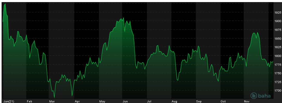
Notowania cen złota, YTD

oraz ewentualnego lockdownu może zdecydować o utrzymaniu aktualnych decyzji co do luzowania ilościowego.