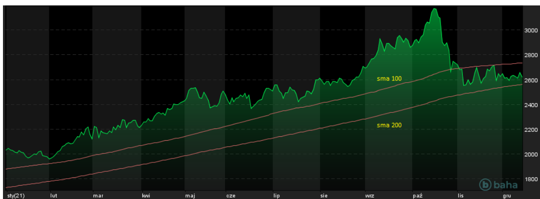
Notowania aluminium LME (3M), YTD

Przez pierwsze 2 tygodnie grudnia 3-miesięczne kontrakty na aluminium na londyńskiej LME wciąż poruszają się w korytarzu wyznaczonym 200- i 100-dniowymi średnimi kroczącymi, które dziś przybierają wartości odpowiednio 2564 oraz 2737 $/MT. Sesja środowa przyniosła przybliżenie do dolnego poziomu, bowiem o 14:20 płacono już tylko 2587 $/MT, co jest najniższym zanotowanym poziomem od 7 dni handlowych.