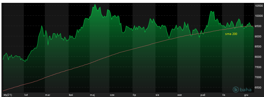
Notowania miedzi LME (3M), YTD, źródło: baha.com