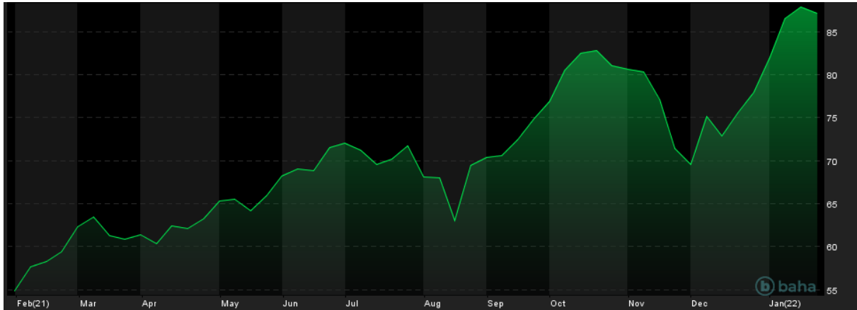
Notowania cen ropy Brent, 1Y

Zagrożenie konfliktem na Ukrainie, z punktu widzenia inwestorów na rynku ropy naftowej, jest istotne ze względu na zaangażowanie Rosji – jednego z największych producentów ropy naftowej na świecie. Potencjalny atak na Ukrainę z pewnością bowiem wiązałby się z sankcjami, a te mogłyby dotyczyć właśnie rynku naftowego, tak kluczowego z punktu widzenia tego kraju.