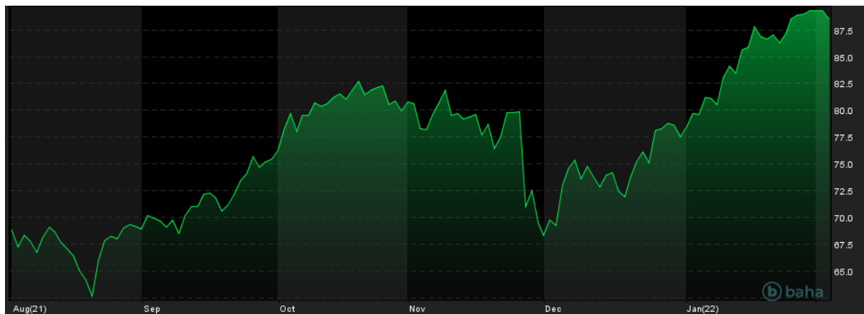
Notowania cen ropy Brent, 6M

Notowania ropy naftowej w poprzednim tygodniu dotarły do najwyższych poziomów od jesieni 2014 roku, a więc od ponad 7 lat. W bieżącym tygodniu zwyżki wyhamowały, jednak notowania ropy nie oddalają się od tegorocznych maksimów. To oznacza, że cena ropy naftowej gatunku Brent nadal porusza się w okolicach 90 USD za barytkę, będącej obecnie kluczową techniczną barierą. Natomiast notowania ropy WTI znajdują się niżej, w okolicach 88 USD za barytkę.