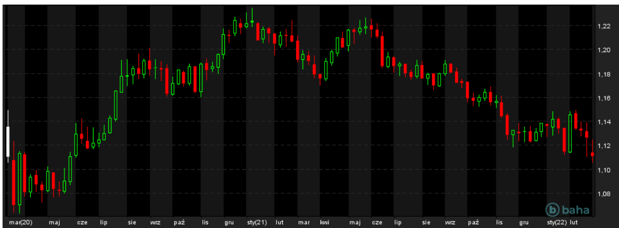
EUR/USD, 2Y

W poniedziałek inwestorzy drastycznie zareagowali na wycenę rosyjskiego rubla względem amerykańskiego dolara. Rosyjski bank centralny musiał interweniować i podniósł stopy procentowe z poziomu 9,5% do 20%. Po podwyżce notowania rubla zaczęły się umacniać. Para walutowa USD/RUB wahała się od 96,111 rubli za jednego dolara do 117,933 w ciągu całej sesji. Wtorek oraz poranek w środę przyniósł kolejne spustoszenie dla rosyjskiej waluty. W najbliższych momentach jego wyceny inwestorzy byli skłonni płacić ponad 120 rubli za każdego dolara. Istotnym jest nakreślić, że USD/RUB na przestrzeni ostatnich tygodni stracił ponad 50% swojej wartości. Na rosyjskim rynku panuje aktualnie brak płynności w sektorze bankowym, a sankcje Zachodu wobec tego sektora finansowego sięgają w nim zamęt.