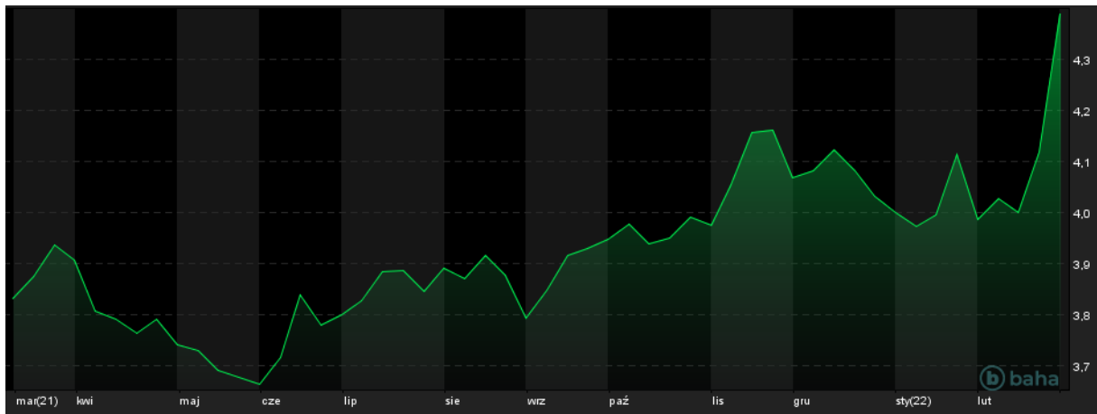
Notowania USD/PLN, 1 Year

Podczas czwartkowej sesji dominowała czerwień. Na nastroje inwestorów zdecydowany wpływ miał wynik rozmów pokojowych. Na ten moment żądania Putina są nieakceptowane dla strony Ukraińskiej, jednakże zostaną utworzone korytarze humanitarne. Na europejskiej sesji można było zauważyć mocne spadki indeksów WIG20 i DAX, które traciły odpowiednio 1,68% i 2,16%. Inwestorzy z Wall Street zareagowali spokojnie, a indeks S&P500 zniżył o 0,53%.