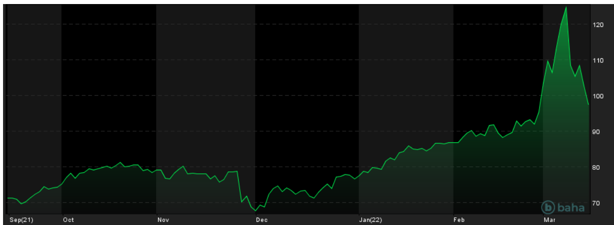
Notowania cen ropy Brent, YTD, źródło: baha.com

Jednocześnie, trwają rozmowy dyplomatów z wielu innych krajów świata na temat sytuacji w Ukrainie i możliwych dalszych sankcji narzucanych na Rosję. W przyszłym tygodniu ma odbyć się rozmowa liderów państw NATO w Europie.