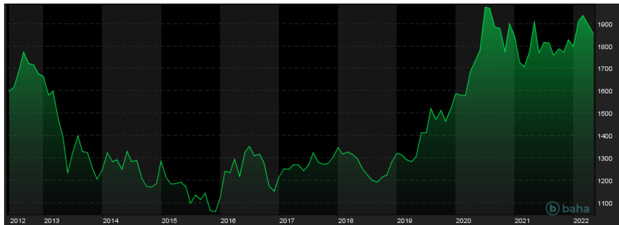
Notowania cen złota, 10Y

Analitycy techniczni dostrzegają na wykresie złota formację filizanki kształtującą się od 2011 roku. Jest to struktura, która przypomina kształtem literę „U”, gdzie po długotrwałej akumulacji następuje element dynamicznego wybicia. Hipotetyczny zasięg tej formacji to 2500-3000 dolarów za uncję. Warunkiem jest jednak wybicie poziomu ostatnich szczytów z marca.