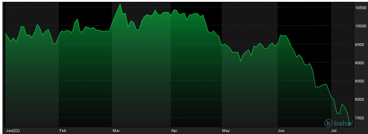
Notowania cen miedzi (3M), YTD, LME, źródło: baha.com

Podsumowując, dane dotyczące importu surowców do Chin w czerwcu trudno jednoznacznie ocenić jako optymistyczne lub pesymistyczne. Sytuacja w tej gospodarce zmienia się z tygodnia na tydzień, a w znaczącym stopniu zmiany te wynikają z liczby zakażeń koronawirusem.