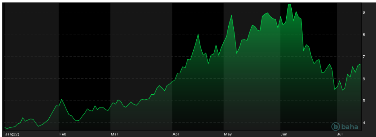
Notowania cen gazu, YTD, NYMEX

O ile sytuacja na rynkach surowców energetycznych była jednoznaczna, to już dane dotyczące importu metali były mieszane. Import rudy żelaza do Chin w czerwcu delikatnie spadł, zarówno w ujęciu rdr, jak i mdm, a wyniósł łącznie 88,97 mln ton w czerwcu. Jednak zupełnie inaczej wyglądała sytuacja na rynku miedzi, gdzie poprzedni miesiąc przyniósł zwiększenie importu aż o 15,5% mdm do poziomu ponad 537 tysięcy ton.