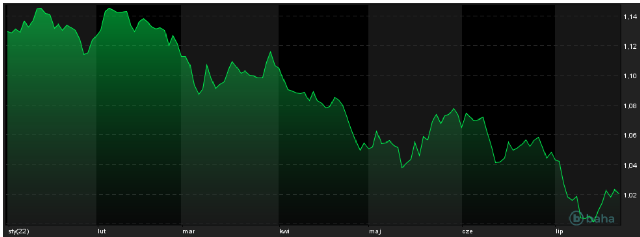
Notowania EUR/USD, YTD

Pomimo podwyżki stóp procentowych powyżej konsensusu przez ECB, kurs EUR/PLN zniżył o 0,09%. Prezes NBP podczas czwartkowego wystąpienia w sejmie zapowiedział kontynuację zacieśniania polityki pieniężnej. Głównymi celami strategicznymi polskiej polityki pieniężnej w bieżącym roku, pozostają obniżka inflacji i utrzymanie zrównoważonego wzrostu gospodarczego. Prezes Głapiński podkreślił, że obniżenie inflacji, którą wywołały silne szoki podażowe musi następować stopniowo, a rządowe wsparcie finansowe powinno się ograniczyć do kredytobiorców tego potrzebujących.