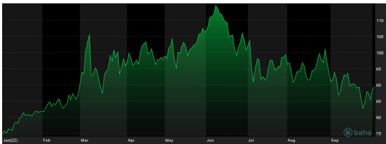
Notowania cen ropy Brent, YTD, źródło: baha.com

Ceny ropy naftowej poruszają się w wyraźnym trendzie spadkowym już od czerwca bieżącego roku. Wynika on z oczekiwań coraz głębszego spowolnienia gospodarczego na świecie, które przekłada się na mniejszy popyt na surowce, w tym na ropę naftową i różne paliwa.