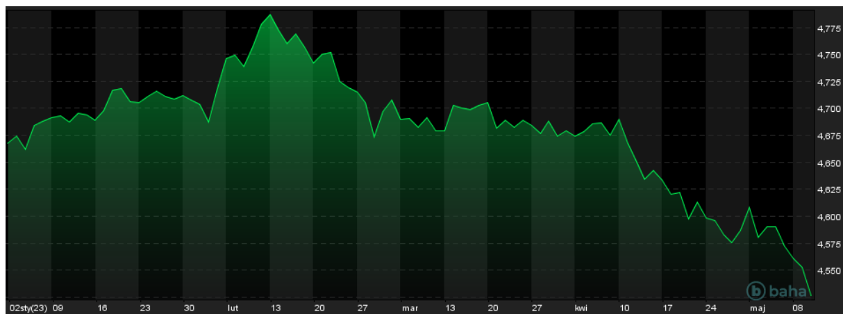
Notowania EUR/PLN, YTD

Za oceanem opublikowany dzisiaj wskaźnik inflacji CPI(r/r) był bardzo zbliżony do oczekiwań rynku osiągając 4,9%, a więc 0,1% poniżej zakładanego konsensusu. Po ogłoszeniu decyzji złotówka umacniała się względem dolara i euro o około 4 grosze, wyznaczając kolejne minima na kursach par walutowych USD/PLN i EUR/PLN. W USA pomimo minimalnego spadku CPI w kwietniu został utrzymany 10 – miesięczny kierunek wyhamowywania inflacji. W Niemczech również nastąpiło spowolnienie tempa obniżania inflacji, która spadała w kwietniu o 0,2p.p. do poziomu 7,2%.