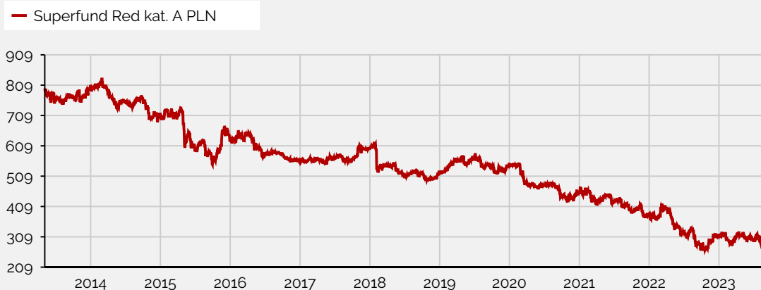
Wykres notowań od: 2013-05-06 do: 2023-08-31.