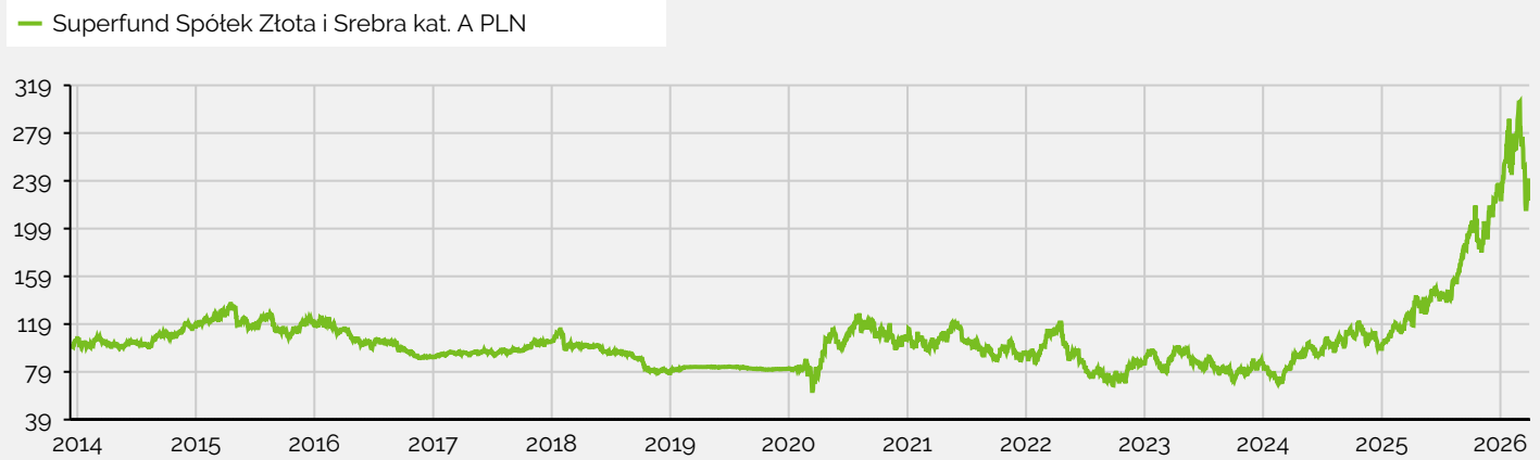
Wykres notowań od: 2013-12-10 do: 2026-03-31.